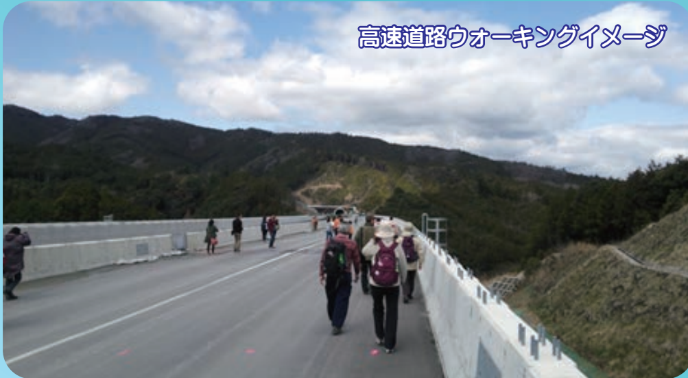
高速道路ウォーキングイメージ