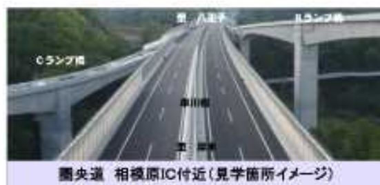
圏央道 相模原IC付近(見学箇所イメージ)