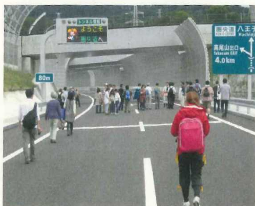
・圏央道見学ウォーキング