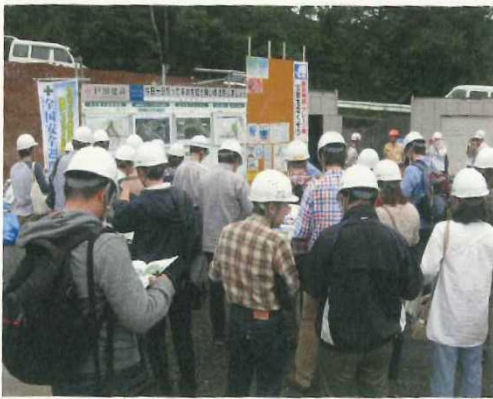
・相模原 IC 建設現場