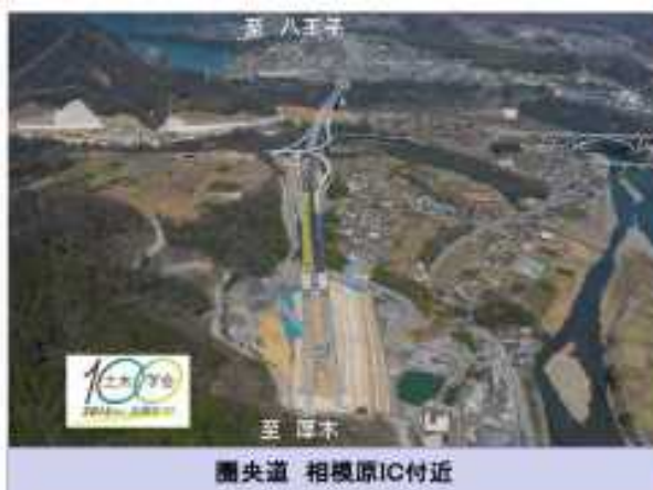
圏央道 相模原IC付近