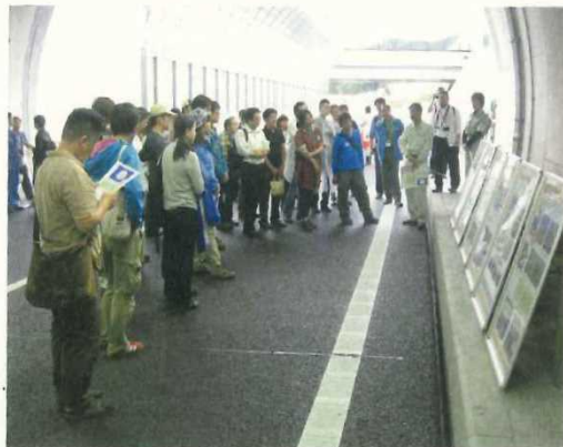
・圏央道見学ウォーキング