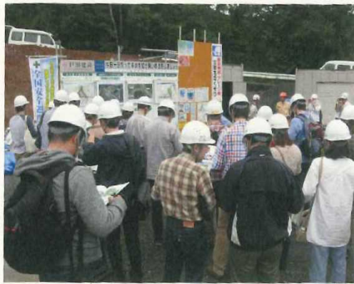
・相模原 IC 建設現場