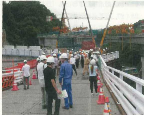
・相模原 IC 建設現場