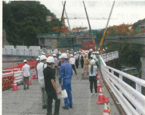
・相模原 IC 建設現場