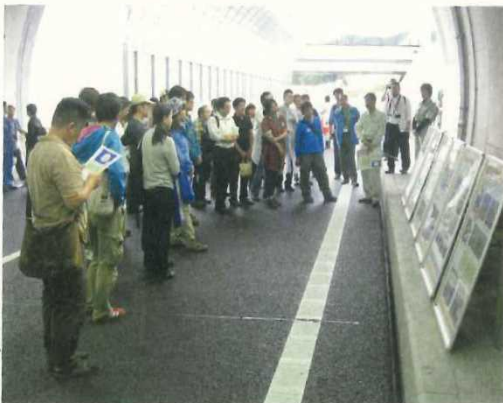
・圏央道見学ウォーキング