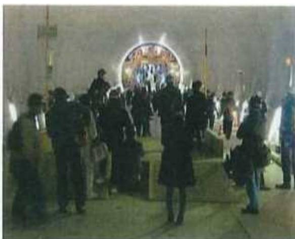
トンネル内にある転車台