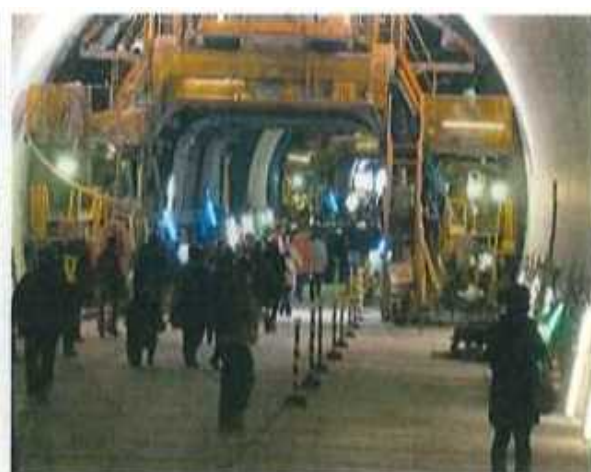
2次覆工の施工部分