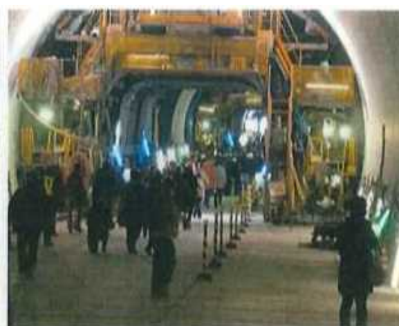
2次覆工の施工部分