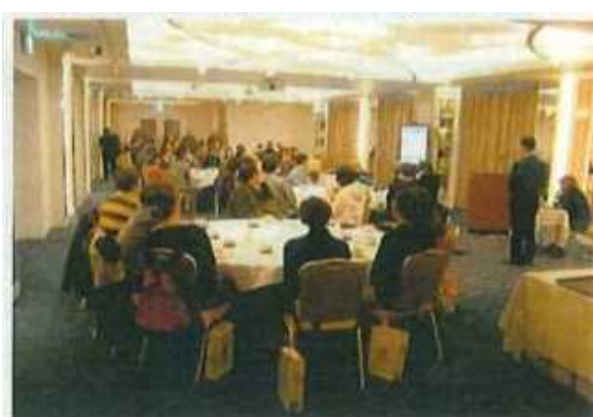
ビデオを注視する参加者