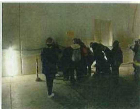
路面床下の避難通路へ通じる開口部に見入る参加者