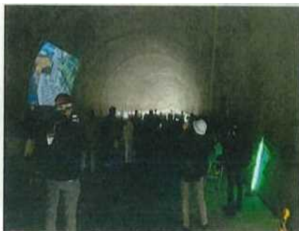
トンネルに壁面に事業概要の動画を映写して説明